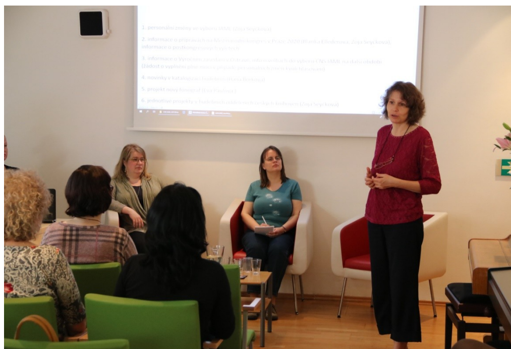
Programový blok ČNS IAML