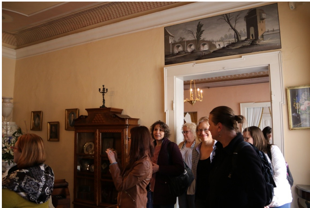
Z prohlídky zámku Jaroměřice nad Rokytnou