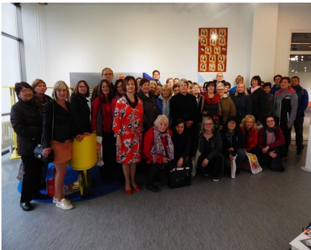
Návštěva Městské knihovny v Piešťanech

Rok 2019 byl pro celý SKIP rokem konání valných hromad a tedy také rokem volebním. Celostátní valná hromada, která se konala v Praze, byla mj. završením kulatých stolů, které probíhaly v každém kraji předchozí rok a také důstojnou připomínkou 100. výročí vzniku prvního knihovního zákona.