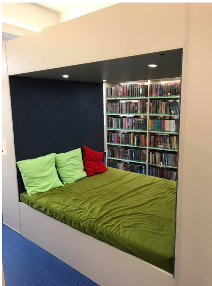
Veselí nad Moravou - postel