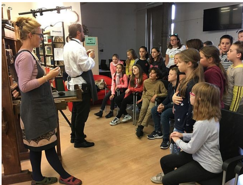
Za příběhem tištěné knihy- Uherské Hradiště