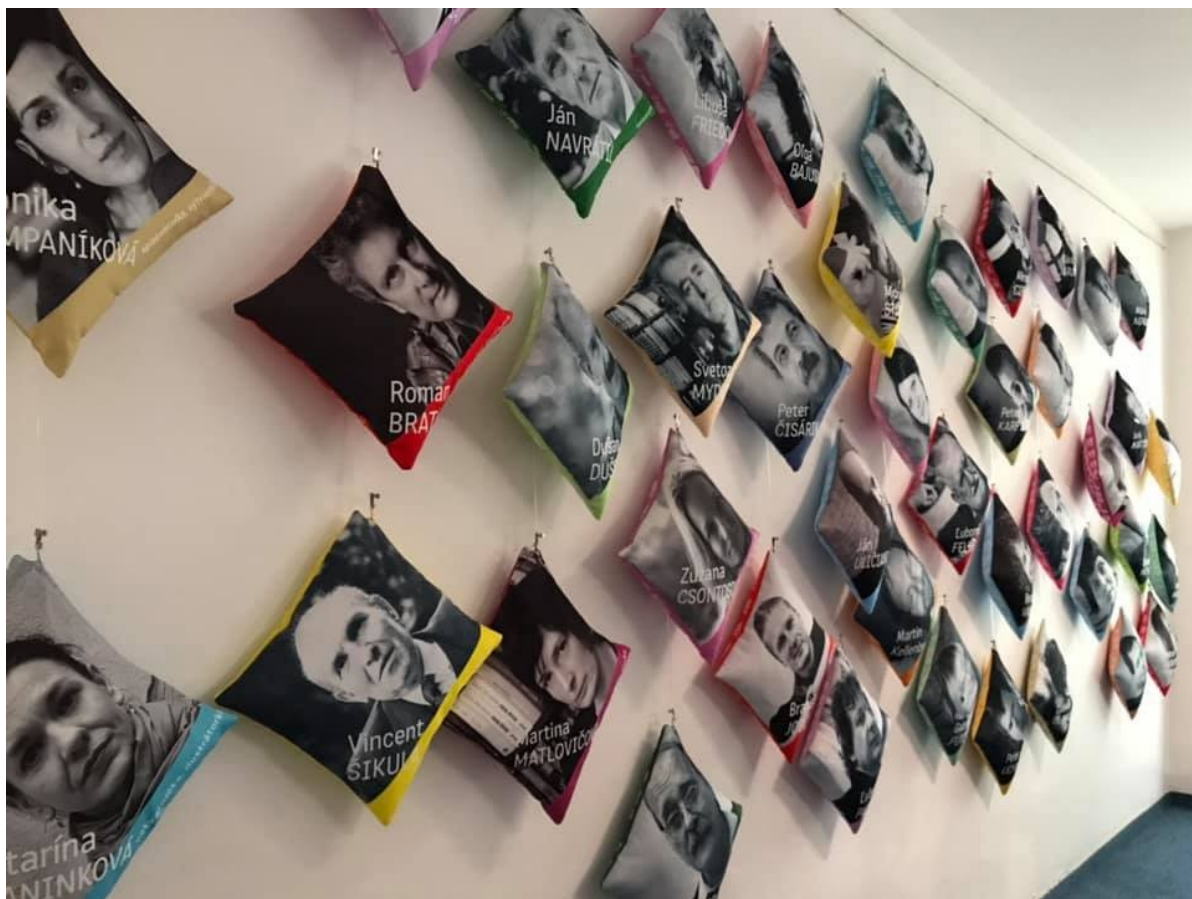
Piešťany - polštáře