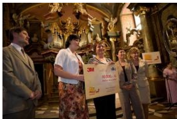
2. místo: Městská knihovna Sedlčany 3. místo: Městská knihovna Havířov

Jak hodnotily soutěž knihovny v jejím průběhu, jak vidí její přínos s odstupem roku nebo ukázky zajímavých postřehů dětí si můžete přečíst na webových stránkách soutěže.