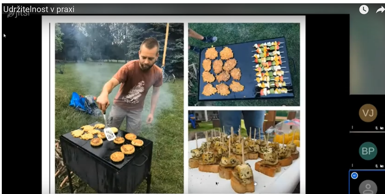
Z webináře Udržitelnost v praxi

dostupných informačních zdrojů, které zpřístupňuje. Akci sledovalo cca sto účastníků. Záznam webináře najdete na YouTube: https://youtu.be/IYHjsVbtgsg .