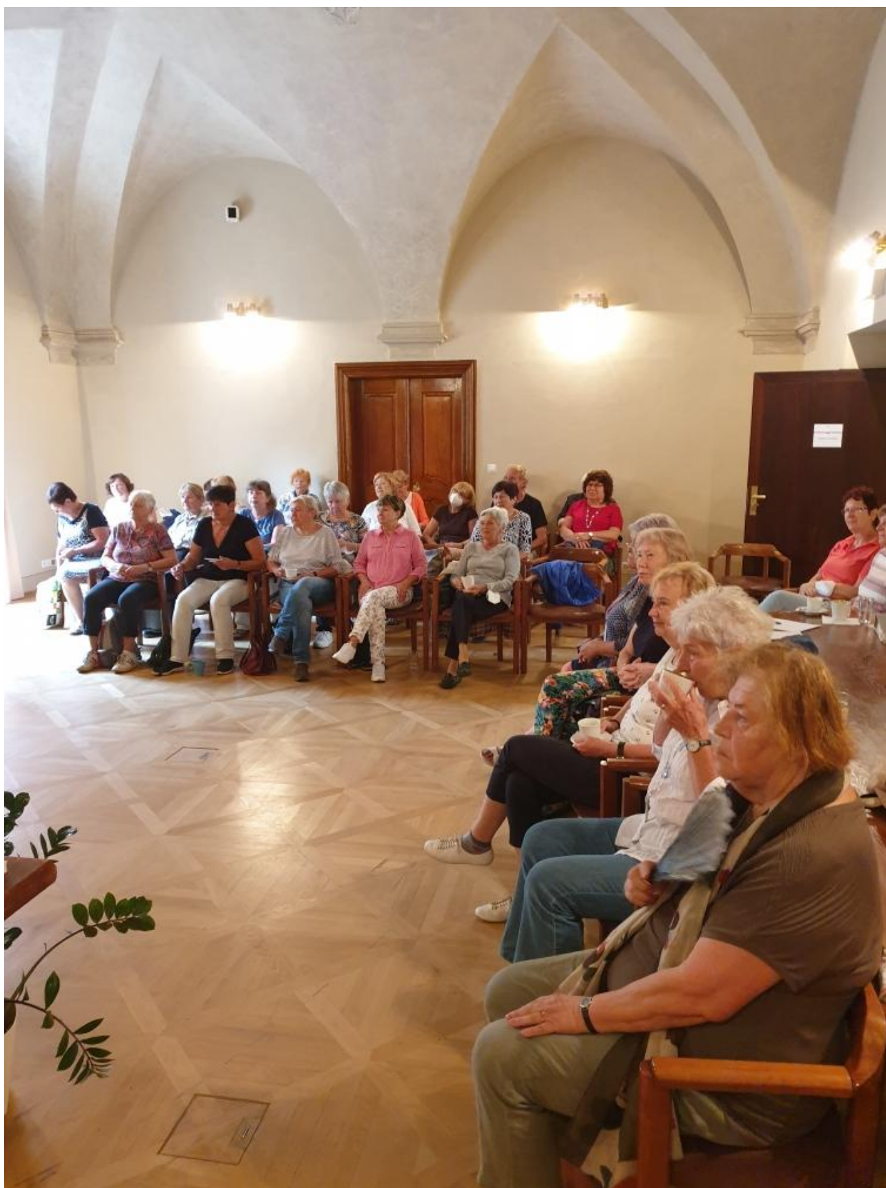
Ze setkání knihovnických seniorů