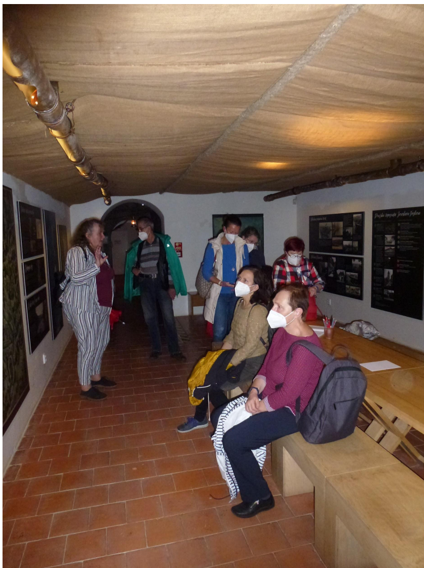
Na foglarovské výstavě

Dne 12. 10. proběhla komentovaná prohlídka výstavy Město jako přízrak. Pražské inspirace Jaroslava Foglara v domě U Zlatého prstenu, tedy v objektu Muzea hlavního města Prahy. Akce se zúčastnilo celkem devět zájemců, kteří se po prohlídce vybraných výtvarných děl znázorňujících místa v Praze, jimiž se Jaroslav Foglar mohl inspirovat, ve sklepních prostorách domu ponořili do tajuplné atmosféry Stínadel. Podrobnosti o výstavě jsou k dispozici na webu muzea: https://www.muzeumprahy.cz/vystavy-a-akce/2022-07-29-00-00-mesto-jako-prizrak-prazske-inspirace-jaroslava-foglara .