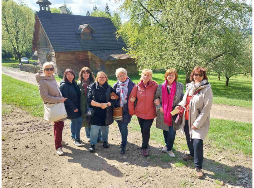
Návštěva skanzenu a spokojené účastnice zájezdu