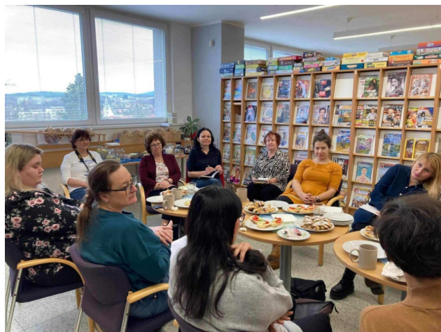
Setkání Příbramského Klubka