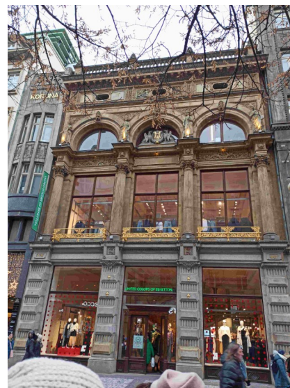
Procházka pasážemi Václavského náměstí