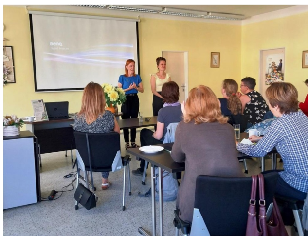
Setkání Středočeského Klubka