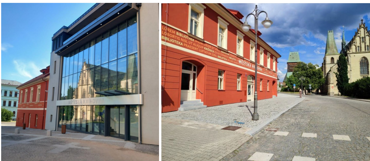
Městská knihovna Rakovník

Rakovnická knihovna nyní sídlí v objektu 3 propojených domů na rohu náměstí. Dva domy jsou historické a rekonstruované pro potřeby knihovny, jeden dům byl postaven na místě zbouraného objektu jako moderní novostavba. Knihovna také využívá prostory dvorku pro různá představení. Ocenění knihovna získala také za četné akce, které pořádá a mezi než patří například sportovně-kulturní akce Rakovnické cyklování.