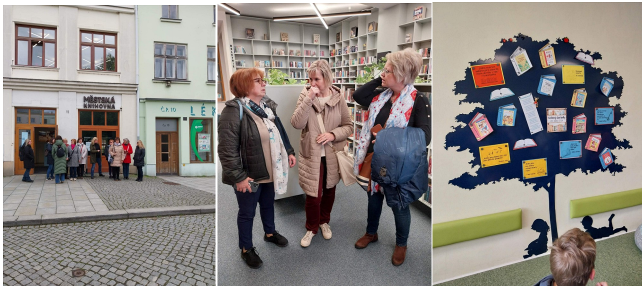
Knihovna Lipník nad Bečvou

Do knihoven v Lipníku nad Bečvou a Rožnově pod Radhoštěm se vydalo 25. - 26. dubna 20 nadšených „skipařek“. Ve čtvrtek zvládly prohlédnout obě knihovny a společně povečeřet. V pátek pak navštívily skanzen v Rožnově, nakoupily suvenýry (hlavně jedlé) a šťastně se vrátily do Prahy. Zajímavé srovnání poskytly členkám SKIPu obě knihovny, kdy Lipník n. B. sídlí v rekonstruovaném domě na náměstí a knihovna v Rožnově v prvorepublikové vile s moderní přístavbou. Každá z knihoven je tak odlišná, ale každá z nich velmi inspirativní.