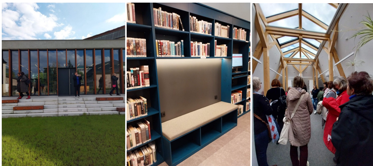
Městská knihovna Rožnov pod Radhoštěm