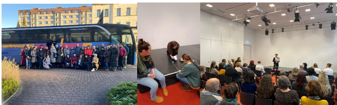
Studijní cesta do Německa 22. – 23. 11. 2024

Celkové náklady na studijní cestu byly 125 261,60 Kč, z toho dotace tvořila 87 500 Kč. Další náklady ve výši 37 761,60 Kč byl vklad žadatele. Vyúčtování dotace proběhne až v roce 2025.