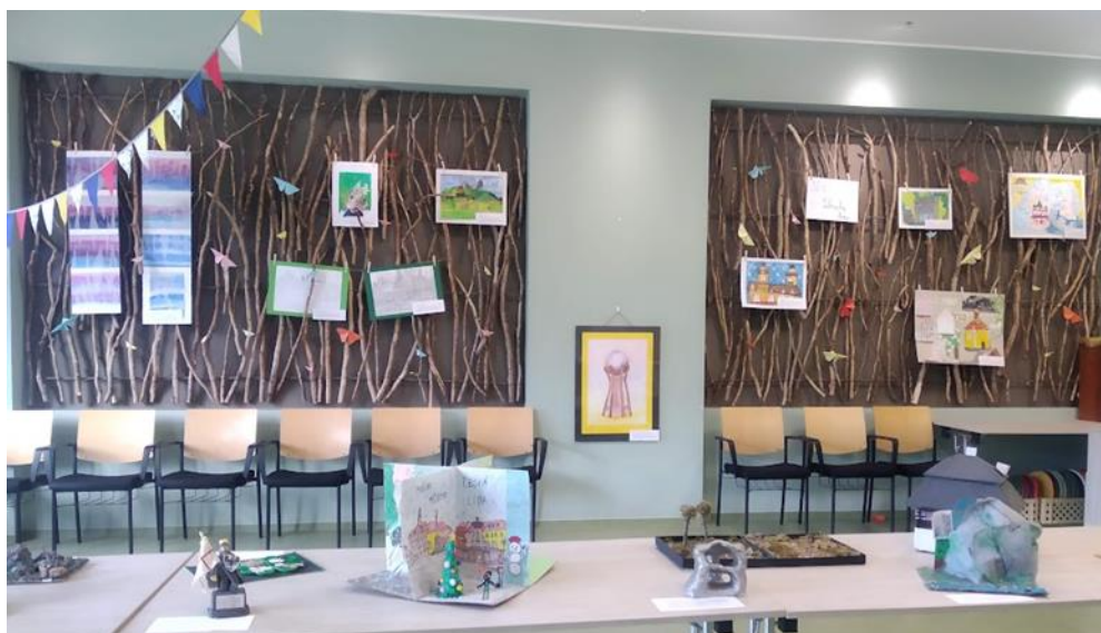
Výstava Sdílej s námi Liberecký kraj. Dům přírody Českého ráje, Dolánky u Turnova, srpen 2024, foto: SKIP.

Itinerář putovní výstavy Sdílej s námi Liberecký kraj, červenec 2024 – červen 2025.