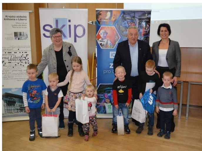
Čtenář roku – ocenění čtenáři 16.3. 2024