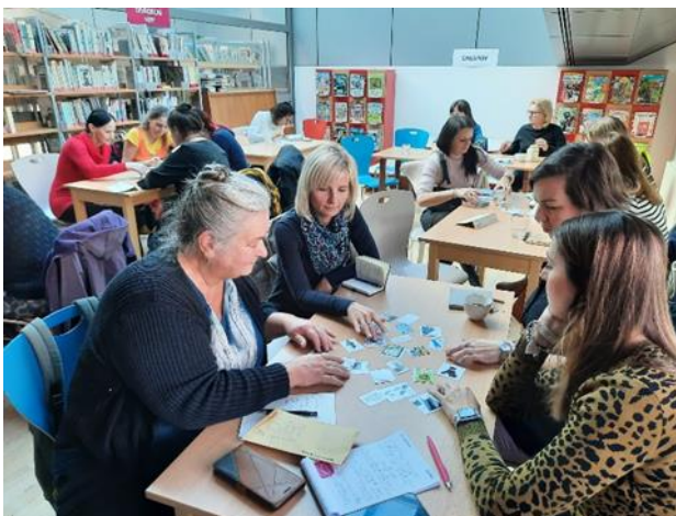
Setkání KDK LK 5. listopadu 2024 v Krajské vědecké knihovně v Liberci