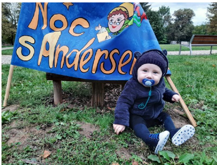
Symbolický průvod NOC A 2020 On line