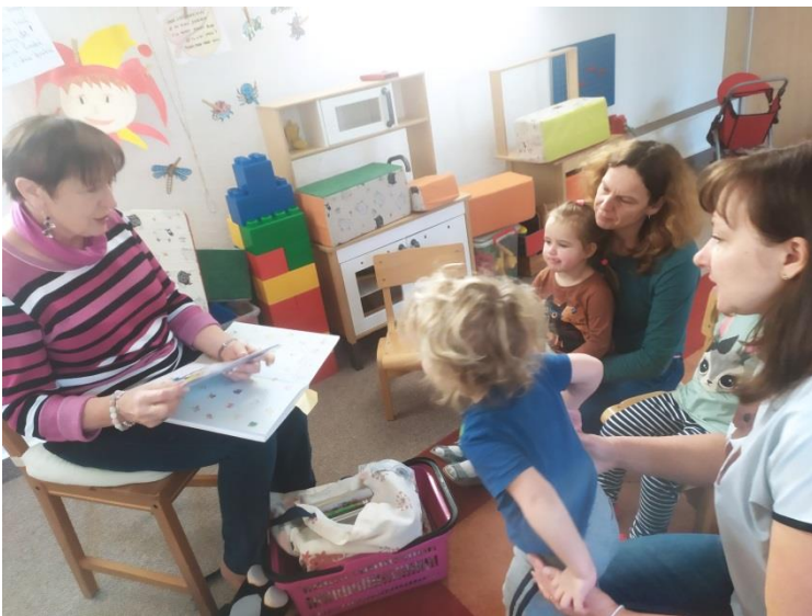
Bookstart – S knížkou do života