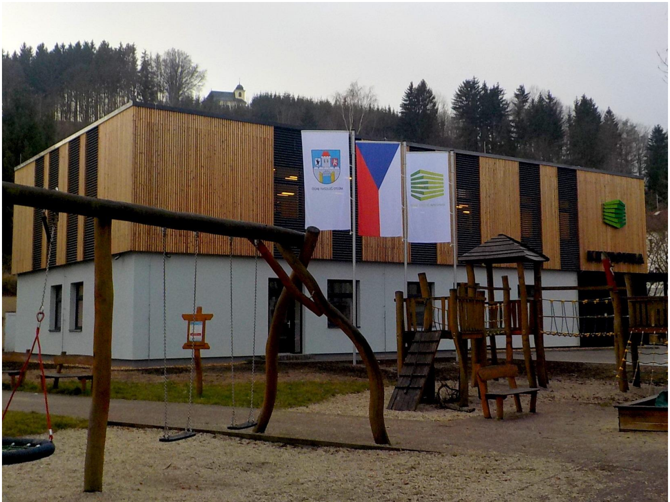
Nová budova knihovny v Železném Brodě