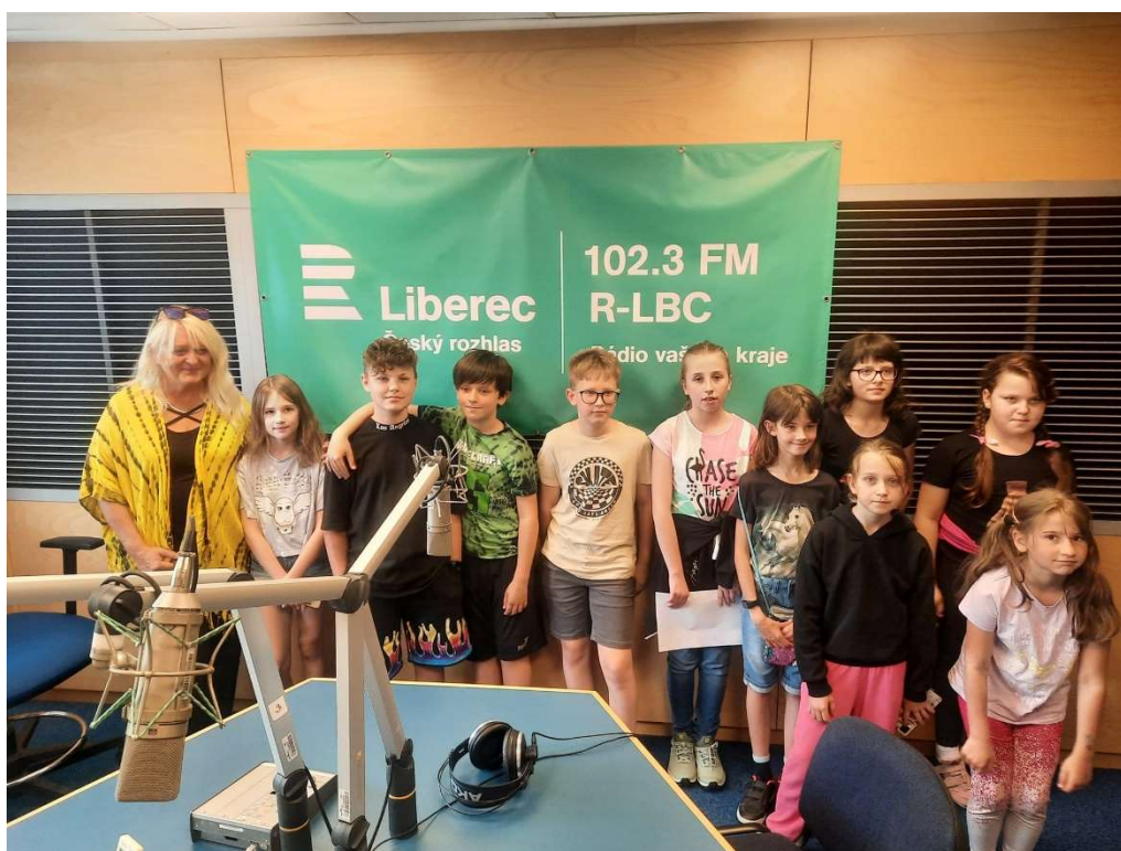
ZŠ a MŠ Slaná na exkurzi v Českém rozhlasu Liberec, červen 2023.