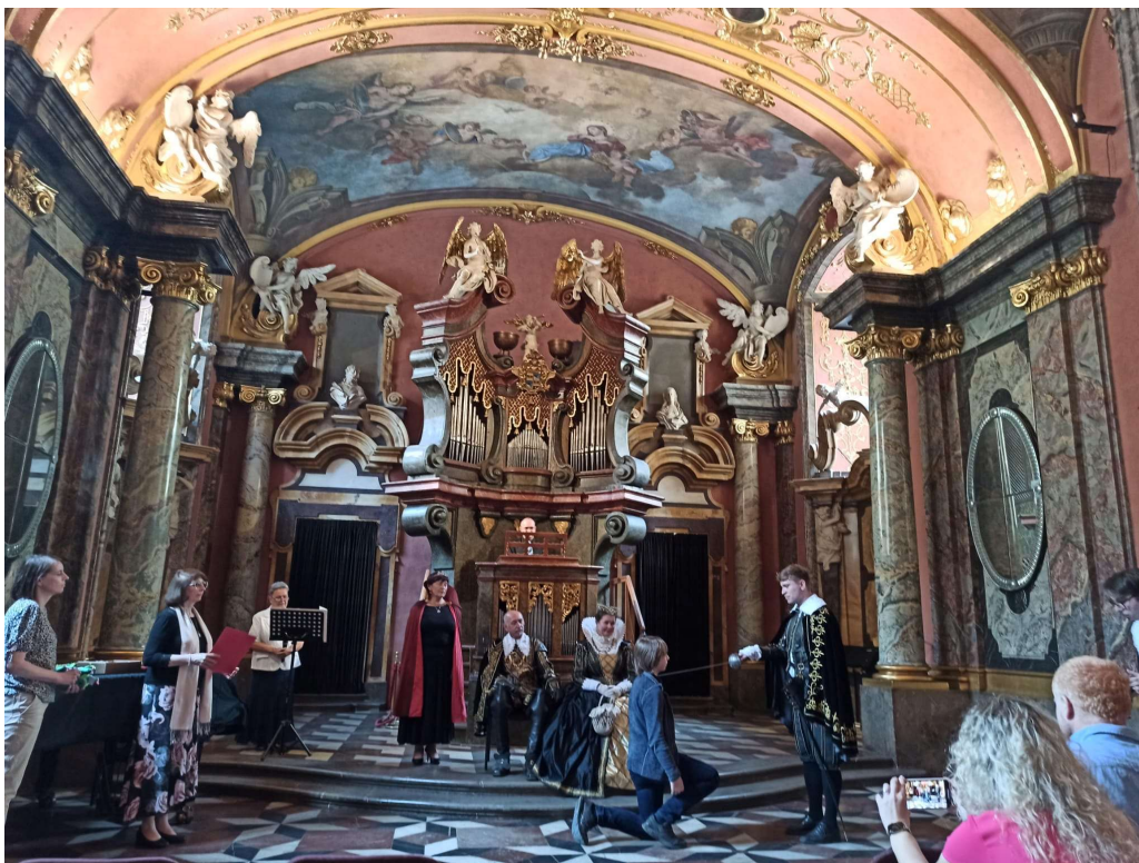
Slavnostní akt pasování vítězů z turnovské ZŠ Žižkova na rytíře krásného slova. Praha, Zrcadlová kaple Klementina, 7. června 2023.