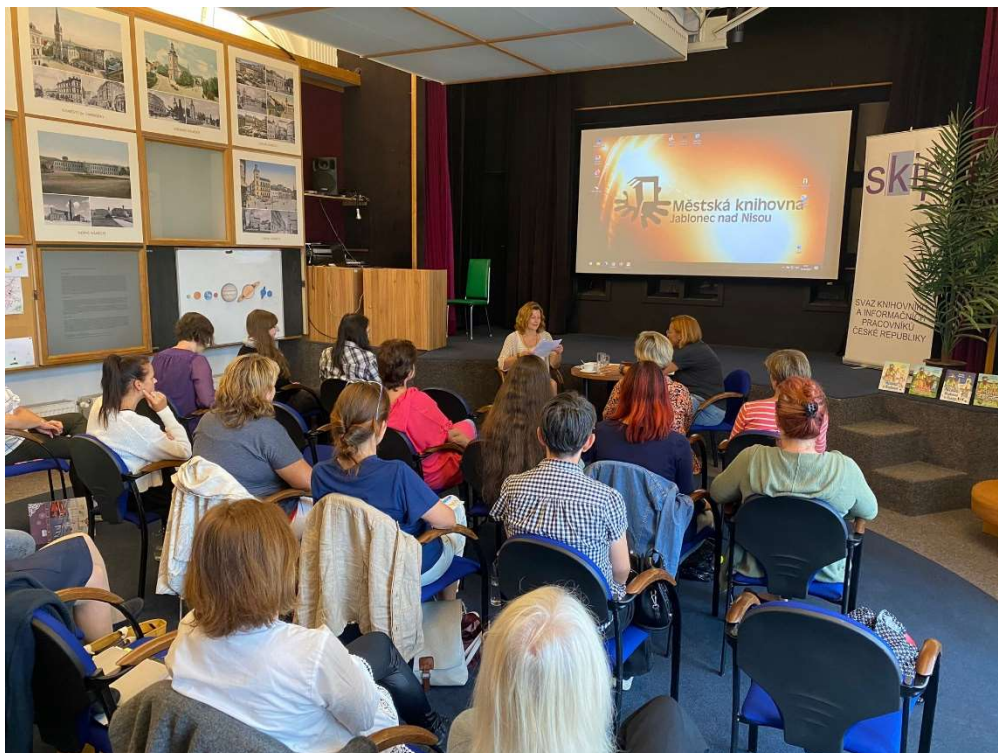
Setkání KDK LK 19. září 2023 v Městské knihovně Jablonec nad Nisou

Setkání bylo zpoplatněno účastnickým poplatkem ve výši 200,-- Kč. Výtěžek měl sloužit na honorář a cestovné pro přednášející, a občerstvení. Nepokryl však náklady do plné výše. Akci finančně podpořila Krajská vědecká knihovna Liberec z dotace na regionální funkce, finančně i organizačně se na realizaci podílel RV SKIP.