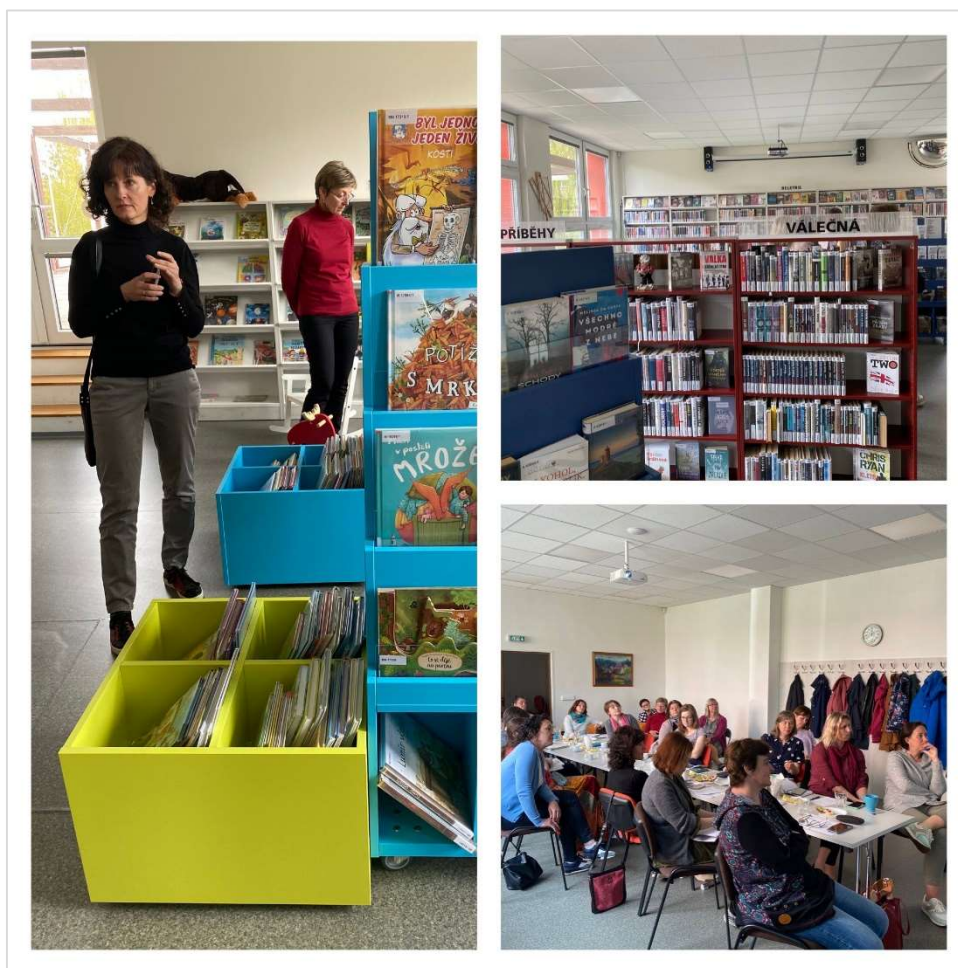
Setkání KDK LK 2. května 2023 v Městské knihovně Česká Lípa, pobočka Špičák

Setkání završila prezentace aktivit Městské knihovny Česká Lípa a exkurze po pobočce Špičák.