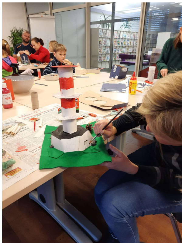
Tvůrčí dílna Modelujeme Semily do soutěže Sdílej s námi, 5. listopadu 2023.

Realizace projektu je rozložena do čtyř etap, z nichž první (tvůrčí činnost, doprovodné programy, sběr prací v zapojených knihovnách) probíhala od září 2023 do konce roku. V dalších etapách (leden-červen 2024) proběhne místní kolo s možností výstavy v zapojených knihovnách (II. a III. etapa), přičemž projekt vyvrcholí regionálním kolem – společnou výstavou vítězných prací vzešlých ze všech přihlášených knihoven v Libereckém kraji. Vernisáž první výstavy; ocenění nejzajímavějších prací (etapa IV).