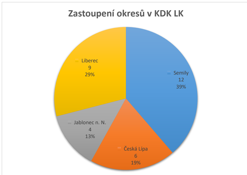
Počty členských knihoven v KDK LK v jednotlivých okresech

Zastoupeny jsou všechny okresy v tomto poměru: