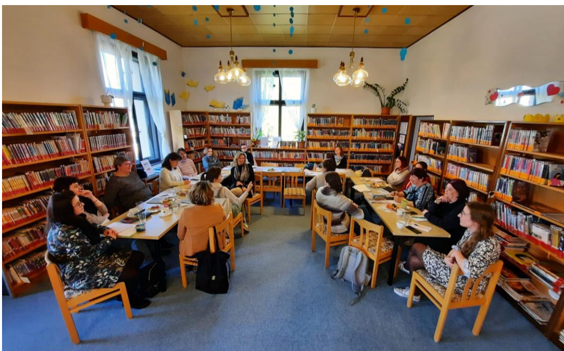
Setkání KDK LK 23. dubna 2024 v Městské knihovně Antonína Marka v Turnově

V odpoledním bloku byla na programu exkurze do neziskové organizace Fokus Turnov s ochutnávkou programu pro teenagery, zaměřeného na prevenci sociálně patologických jevů a destigmatizaci duševních onemocnění.